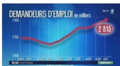
JT – 20h – France 3