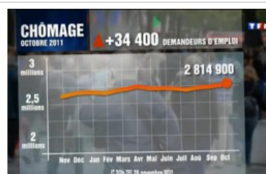
JT – 20h – TF1