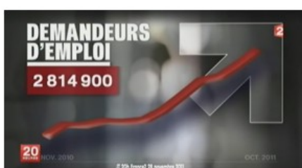
JT – 20h – France 2