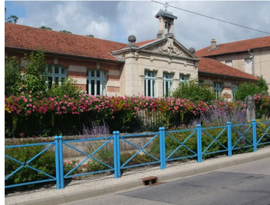
École du Pont des Arts à Sampigny