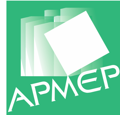
Association des Professeurs de Mathématiques de l'Enseignement Public Régionale de Lorraine